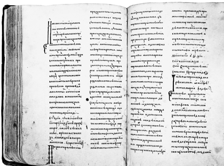
1. Папский Восточный институт (Рим, Италия). Slavo 5, л. 146 об.—147. Житие Иоанна Новгородского «от града Орешка».

Новгородские жития в Прологе Папского Восточного института нельзя рассматривать как сколько-нибудь надежный исторический источник, но они имеют бесспорное литературное значение, поскольку свидетельствуют об отражении в книжности начала XVI в. устных по своему происхождению представлений и сведений о русской истории.