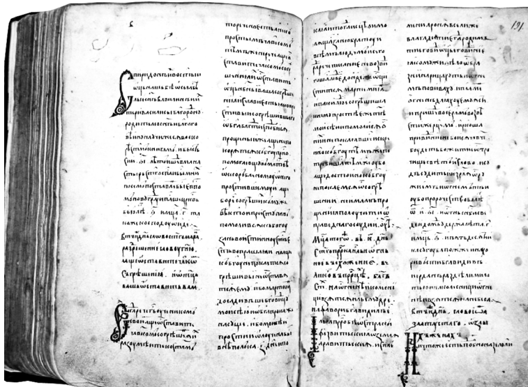
2. Папский Восточный институт (Рим, Италия). Slavo 5, л. 190 об.—191. Житие Спиридона Новгородского.