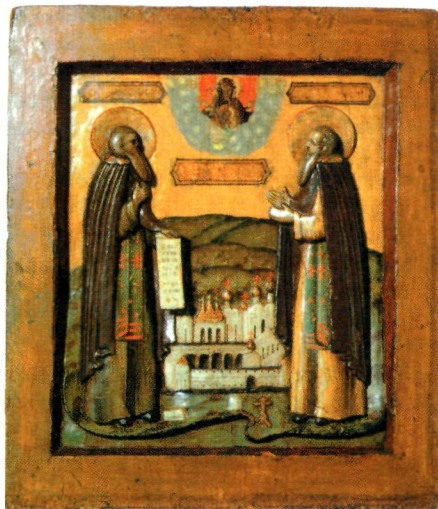
Преподобные Зосима и Савватий Соловецкие. Икона. 2-я пол. XVII в. (ГММК)

кого мон-ря Александром (Павловичем) на рассмотрение в С.-Петербургский духовно-цензурный комитет (цензурная история текста отразилась в деле РГИА. Ф. 807. Оп. 2. Д. 1311 (1860 г.)). Первая редакция акафиста была отклонена из-за частного характера упоминаемых в прошениях «действий, обстоятельств и событий» ( Попов . 1903. С. 207–208). В мае 1859 г. новый настоятель Соловецкого мон-ря архим. Мелхиседек представил в комитет исправленную редакцию акафиста, в сопро-