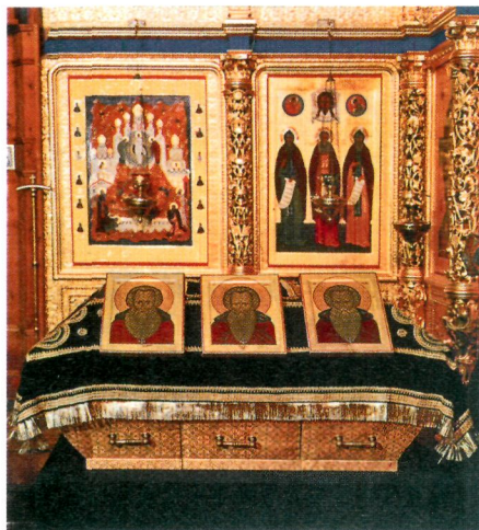
Рака с мощами преподобных Зосимы, Савватия и Германа (Спасо-Преображенский собор). Фотография. 1992 г.

В апр. 1989 г. мощи Соловецких преподобных были предъявлены церковной комиссии во главе с Ленинградским и Новгородским митр. Алексием (Ридигером) ; впоследствии Патриарх Московский и всея Руси). 16 июня 1990 г. состоялась торжественная передача Церкви св. мощей З., С. и Германа, к-рые были перенесены в Троицкий собор Александро-Невской лавры. 19–20 авг. 1992 г. св. мощи, сопровождаемые Патриархом Алексием II, были перевезены на Соловки и установлены в монастырском Спасо-Преображенском соборе, где 21 авг. было совершено богослужение, посвященное памяти перенесения мощей З. и С. в 1566 г. В кон. августа мощи З. Соловецких преподобных были перенесены в надвратную ц. Благовещения Пресв. Богородицы, освященную Патриархом Алексием II 22 авг. В память