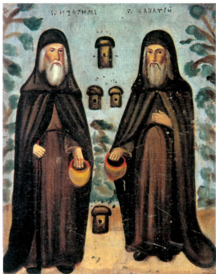
Преподобные Зосима и Савватий Соловецкие. Икона. 2-я пол. XIX в. (ГМИР)

Особое почитание З. и С. существовало в старообрядческом Выголексинском общежительстве , созданном в кон. XVII в. в Заонежье. Старообрядцы Выга считали себя преемниками соловецких иноков и вели отсчет истории Выговской пуст. со времени основания Соловецкого мон-ря. Один из приделов Богоявленской соборной часовни в Выговской пуст. был посвящен З. и С. Андрей и Семен Денисовы и 2 неизвестных выговских автора написали 8 Похвальных слов З. и С., в них подчеркивалась особая роль преподобных в духовном просвещении Поморья.