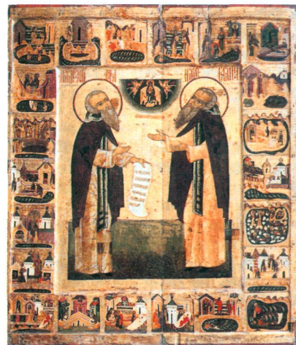
Преподобные Зосима и Савватий Соловецкие, с житием. Икона. Кон. XVI в. (ГРМ)

Иконография. Образы З. и С. тесно связаны, их иконография развивалась параллельно, как и традиция изображения преподобных Антония и Феодосия Киево-Печерских, Иоанна и Логгина Яренгских, Вассиана и Ионы Пертоминских и др. На Соловецких о-вах сохранилось много мест, связанных с З. и С., где находились их иконы. На берегу моря (в 2 км от мон-ря) была поставлена ча-