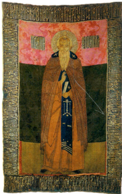
Прп. Зосима Соловецкий. Покров. Кон. 90-х гг. XVI в. Мастерская царицы Ирины Годуновой (ГММК)

О последних годах жизни З. в Житии рассказывается, что святой пребывал в неустанных молитвенных подвигах; он сделал гроб для себя, поставил его в сенях кельи и каждую ночь плакал над гробом о своей