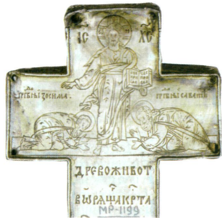
Преподобные Зосима и Савватий, припадающие ко Христу. Крест воздвизальный. 1560/61 г. (ГММК). Фрагмент

Особенно широко распространилось почитание З. и С. среди жителей Поморья. К помощи преподобных прибегали во время бедствий на море, к их гробницам привозили больных, одержимых нечистыми духами. Иконы З. и С. появились в домах поморов задолго до того, как их стали писать в Соловецком мон-ре. Об этом повествуется в рассказах о чудесах святых, включенных в их Жития. В первых 10 повествованиях, записанных учеником З. Досифеем в 1503–1510 гг., сообщается о чудесах преимущественно З. (только в 2 рассказах: «О видении столпа огненаго» и «О погибшем сокровище», — описано явление обоих Соловецких преподобных). Указанные 10 рассказов повествуют о чудесах, происходивших прежде всего с соловецкими монахами. В завершение каждого повествования Досифей напоминает, что З. по своему обещанию духом пребывает с соловецкой братией, о чем свидетельствуют опи-