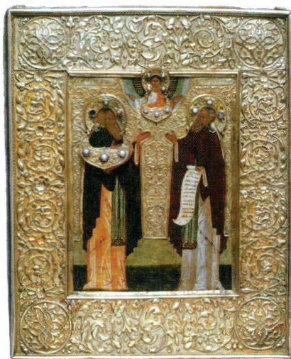
Преподобные Зосима и Савватий Соловецкие. Икона. 1-я пол. XVI в. (ГММК)

ЗОСИМА († 17.04.1478, Соловецкий монастырь) И САВВАТИЙ († 27.09.1434 или 1435), преподобные (пам. 17 апр. (З.), 27 сент. (С.), 8 авг. — 1-е и 2-е перенесения мощей, 9 авг. — в Соборе Соловецких святых, 21 мая — в Соборе Карельских