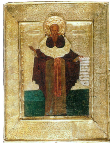
Прп. Зосима Соловецкий. Икона. Кон. XVI в. (ГММК)

стиг юношеского возраста, принял монашество. Место его иноческого пострига не названо в Житии, но из текста следует, что, приняв монашество, З. оставался жить в родном селе, т. е., вероятно, он был пострижен священноиноком, служившим в ближайшей приходской церкви (Жития прп. Зосимы и Савватия.