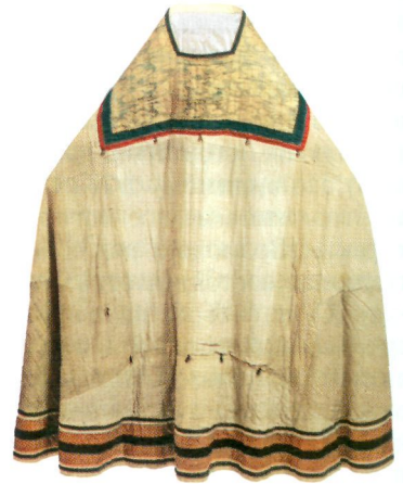
Фелонь прп. Зосимы Соловецкого. Сер. XV в., XVII в. (ГММК)

вецкого мон-ря XVI в. 2003. С. 44). 2 сент. 1545 г. состоялось перенесение мощей З. в новую часовню (эта дата указана в 8 рукописях XVI в., в частности, в таких авторитетных