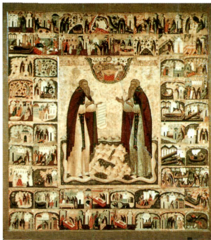
Преподобные Зосима и Савватий Соловецкие, с житием. Икона. Сер. — 2-я пол. XVI в. (ГИМ)

От редакции игум. Вассиана зависит редакция ВМЧ (в исследовании Минеевой она названа 1-й стилистической), созданная на рубеже 20-х и 30-х гг. XVI в. Вероятнее всего, Жития З. и С. были включены в Софийский комплект ВМЧ, создававшийся в Новгороде в 1529–1541 гг. под рук. архиеп. св. Макария . Апрельский том Софийского комплекта утрачен, но данная редакция дошла в 35 списках, включая Успенский и Царский списки ВМЧ. Производной от редакции ВМЧ, как установила Минеева, является волоколамская редакция (представлена списком РГБ. Ф. 113. Волоч. № 659, 30-е гг. XVI в.; лубл.: БЛДР. Т. 13. С. 36–153, 756–773). Из всех ранних редакций она является наиболее полной и литературно обработанной. В ней со-