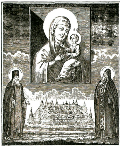
Преподобные Зосима и Савватий перед иконой Божией Матери «Одигитрия». Гравюра. 1849 г.

крест, ризы З. и принадлежавшая ему Псалтирь. Все эти находки стали предметами особого почитания. В 1548 г., при игум. Филиппе, были записаны 11 «новосотворенных чудес» З. и С. и Предисловие к ним. Вероятно, тогда же по просьбе игум. Филиппа и соловецкой братии Лев Аникита Филолог написал Похвальные слова З. и С. и составил новые редакции служб преподобным (старший список — РНБ. Кир.-Бел. № 35/1274, 1550 г.). После 1547 г. был создан общий канон З. и С. (с краегранесием: «Прими пение, Саватие,