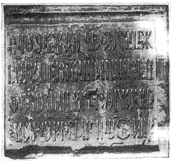
Надгробная плита на могиле Симеона Полоцкого.