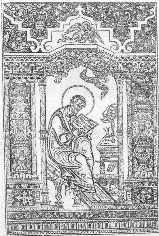
Разворот листов. Евангелист Матфей и оформление начальной страницы Евангелия от Матфея. Четвероевангелие, 1606 г. Издание О. М. Радিশевского (ГРМ, Др./гр. 81, л. 13 об.—14).